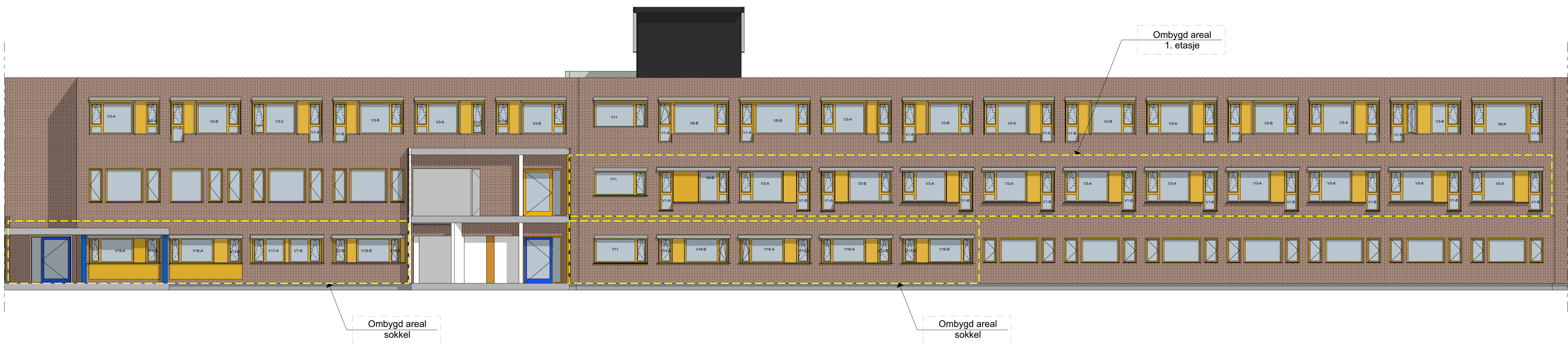
1:100 Fasade sør